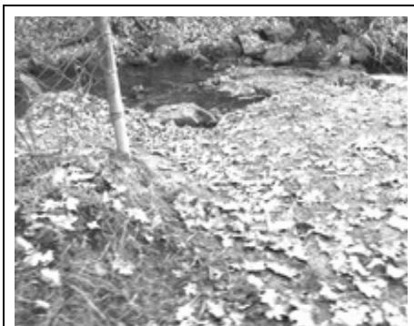
Die gefährliche Ecke vorher.

Der Vorsitzende des Heimat- und Geschichtsvereins setzte sich daraufhin mit der