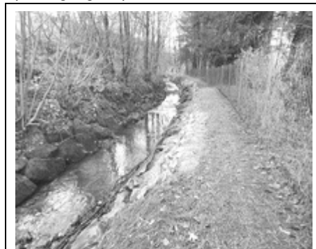
Das Bachbett ist abgemauert und der Weg geschottert.