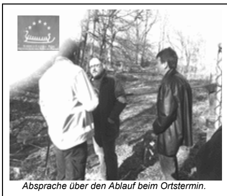
Abgesprache über den Ablauf beim Ortstermin.