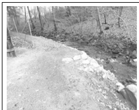
Jetzt ist die Ecke des Weges sicher für Spaziergänger.