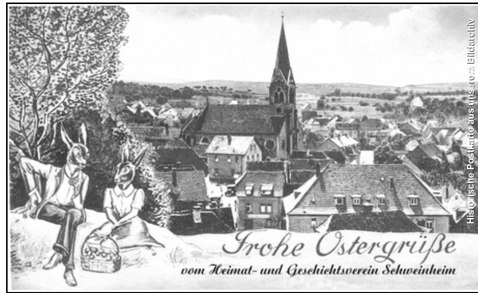
Historische Postkarte aus unserer Bildarchiv

Eine ca. 30minütige Präsentation von DVD mit Ton wird dann bei Bedarf entsprechend aufgelegt.