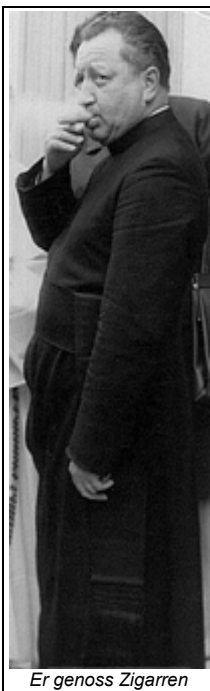
Er genoss Zigarren

Textpassagen aus Main-Echo