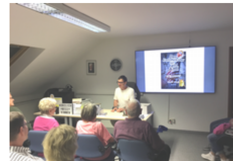
Der Vortrag begann mit dem Kapitel Äpfelwoi“.