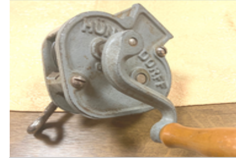
Die Bohnenschneidmaschine, ein Relikt aus den 70ern.