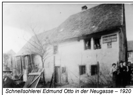
Schnellsohlerei Edmund Otto in der Neugasse – 1920

HUGV_Schweinheim_MTB_20240411_Kartoffelkaefer_StrassenNeugasse_Konto_KW15