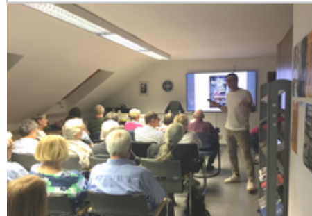
Lebhaft begann der Autor mit einer Zeitreise.