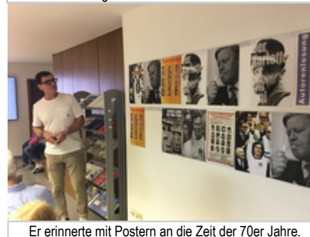
Er erinnerte mit Postern an die Zeit der 70er Jahre.