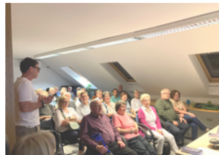
Unsere Geschäftsstelle war voll besetzt.

Wegen des überaus großen Zuspruchs wollen wir diese Veranstaltung in nächster Zeit wiederholen. KHP